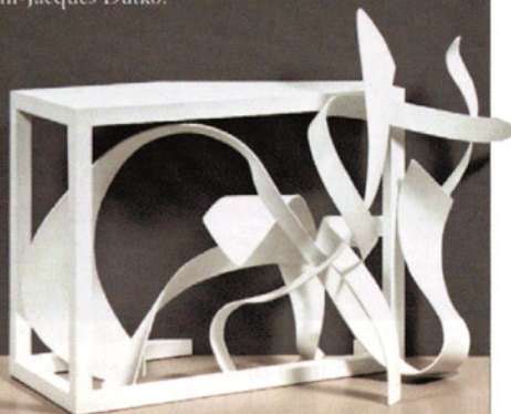
Console "Supercordes", en acier peint, BENOIT LEMERCIER à la galerie Jean-Jacques Dutko.