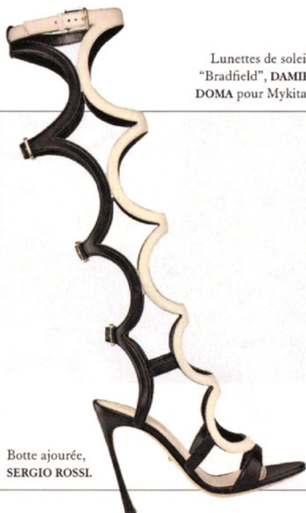
Botte ajourée, SERGIO ROSSI.