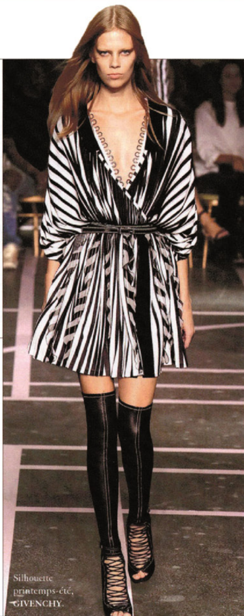
Silhouette printemps-été, GIVENCHY.