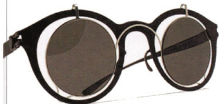
Lunettes de soleil "Bradfield", DAMIR DOMA pour Mykita.