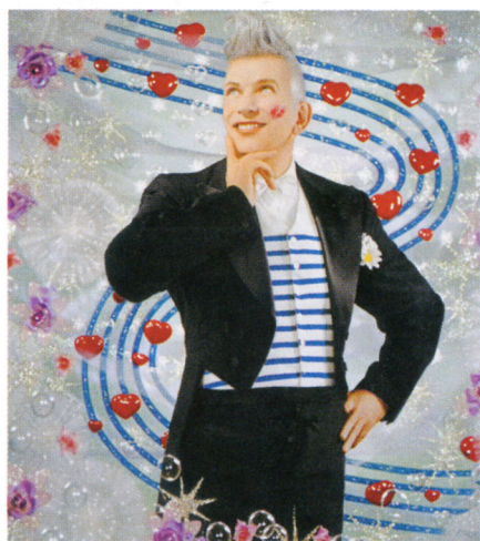
PIERRE ET GILLES. De la rue aux étoiles, Jean Paul Gaultier, 2014. © Pierre et Gilles.

première exposition consacrée au couturier français Jean Paul Gaultier au Grand Palais à Paris. Surnommé « l'enfant terrible de la mode » par la presse dès ses premiers défilés dans les années 1970, il est incontestablement l'un des créateurs les plus importants de ces dernières décennies. L'exposition – que le couturier considère comme une création à part entière et non simplement comme une rétrospective – rassemble 175 ensembles accessoirisés, essentiellement de haute couture, mais aussi de prêt-à-porter créés entre 1976 et 2014. La star de la coiffure Odile Gilbert (Atelier 68) a inventé spécialement pour chaque mannequin des créations en cheveux. De nombreux objets et documents d'archives sont également révélés au public pour la première fois. Croquis, costumes de scène, extraits de films, de défilés, de concerts, de vidéoclips, de spectacles de danse, et même d'émissions télévisées illustrent ses collaborations artistiques les plus emblématiques. Une place importante sera également accordée à la photographie de mode grâce aux prêts de tirages souvent inédits de photographes et d'artistes contemporains renommés. Du 01 avril au 03 août 2015. www.grandpalais.fr